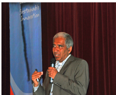
Prof. Mojib Latif